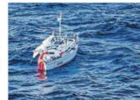
Het onbekende zelschip 'Happy' drijft zonder mast op de Noord-Atlantische Oceaan.

Jaap Barendregt en Wytse Bouma namen deel aan de OSTAR-race wanneer ze ter hoogte van New Foundland in grote problemen raken. In een storm van bijna 60 knopen vint twintigjarige en geboren in 15 tot 20 meter gaat het goed mis. Happy gaat over de kop en de mast 'vliegt' overboord.